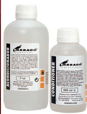
CONDITIONER Арт. TPP04, фляжка 1000 мл и 500 мл., бесцветный.

Специально разработанная жидкая основа (грунтовка) для подготовки кожи к покраске. Обеспечивает лучшее проникновение и фиксацию цвета. Предназначено для натуральной кожи. Не рекомендуется для синтетических кож. Может использоваться как краситель для замши и нубука. Применение: Предварительного удаления защитного покрытия кожи не требуется. Нанести на поверхность с помощью кисточки или распылителя. Дать высохнуть 6 часов, затем нанести Tarrago Color Dye или другой краситель. Для перекраски кожи из более темного цвета в светлый используйте бесцветный Primer. Для перекраски из светлого оттенка в более темный используйте цвет грунтовки (Primer), наиболее близкий к цвету покраски Color Dye .