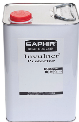
INVULNER PROTECTOR Арт. 0779, канистра 5л., бесцветный.

Универсальный краситель для всех видов натуральной и синтетической гладкой кожи, велюра, нубука, текстиля (кроме перламутровых). Глубоко проникает в структуру кожи, очень эффективно подкрашивает и перекрашивает, отличается высокой стойкостью и качеством окрашивания.