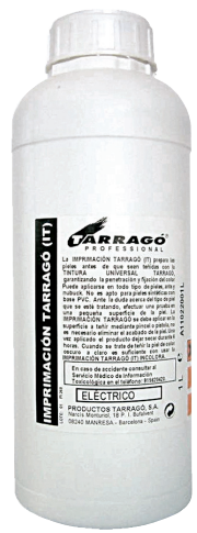
PRIMER Арт. TPP11, фляжка 1000 мл., 9 цветов.

Очиститель для подготовки поверхности изделий из гладких видов кожи к покраске или перекраске. Применение: Обрабатывать изделие с помощью ткани, предварительно смоченной в очистителе. Внимание! Удаляет старую краску при обработке слабопигментированной кожи.