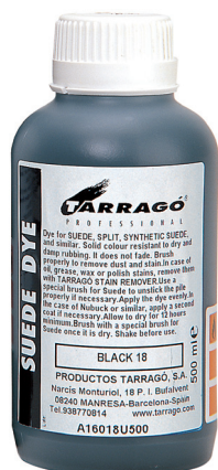
SUEDE DYE Арт. TPP16, флакон 500 мл., черный, т. коричневый, т. синий.