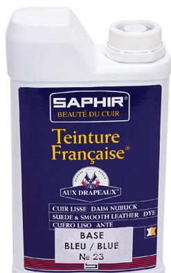
TEINTURE FRANCAISE Арт. 0814, флакон 500 мл., 12 цветов.